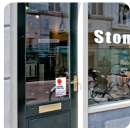
1. Ga naar een TCW acceptatiepunt

website: www.ticketcleanway.nl . Indien er geen stomerij op een redelijke afstand van de werk- of woonplaats is aangesloten, dan spannen wij ons in om een acceptatiepunt aan te sluiten.