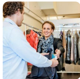
2. Lever kleding en kaart in