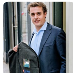
6. Ziet er perfect uit