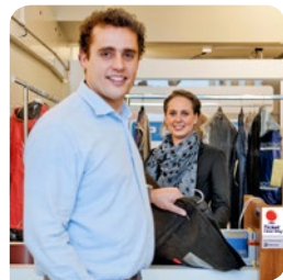
5. Kleding ophalen