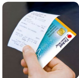
4. Kaart en bonnetje terug